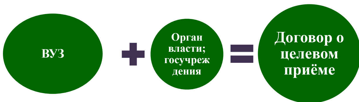
Схема 3. Заключение договора о целевом приёме.