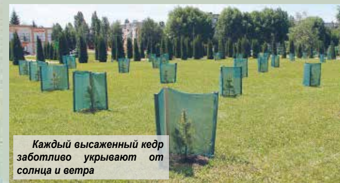
Каждый высаженный кедр заботливо укрывают от солнца и ветра

Недавно в наши края завезли кедровые сосны. Считается, что это дерево выделяет фитонциды, которые обезоруживают вредоносные вирусы и