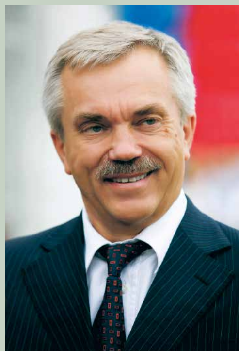
Губернатор Белгородской области Евгений САВЧЕНКО