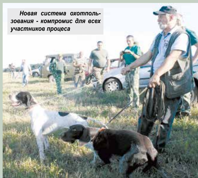
Новая система охотпользования - компромисс для всех участников процесса

В прошлом году лесные пожарные страны ликвидировали больше 8,7 тыс. пожаров. А в нашей об-