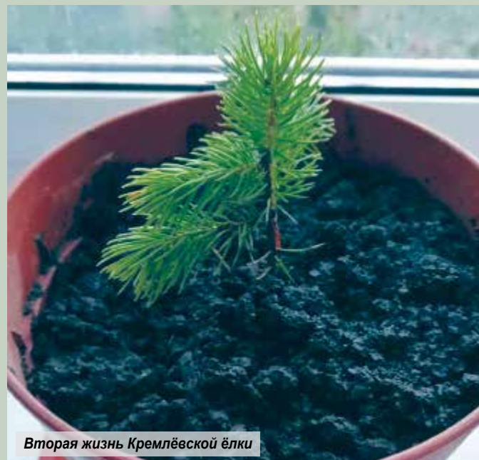
Вторая жизнь Кремлёвской ёлки