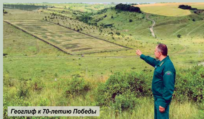
Геоглиф к 70-летию Победы

Природа в долгу не остаётся. В 2018 году наш многовековой дуб из Дубового занял призовое место на конкурсе «Европейское дерево года». Четыре дерева из Дубового, Старого Оскола, Ше-