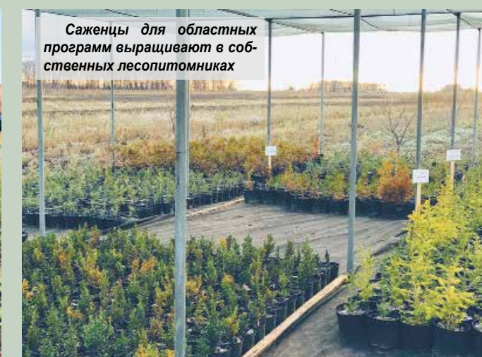
Саженьцы для областных программ выращивают в собственных лесопитомниках