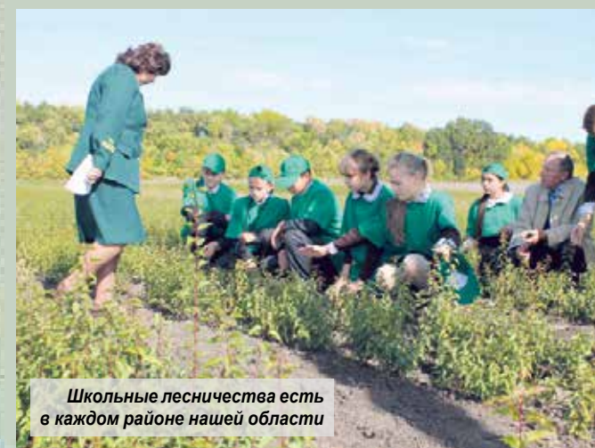
Школьные лесничества есть в каждом районе нашей области

К слову, сведения о лесных пожарах и о нарушениях природоохранного законодательства нужно