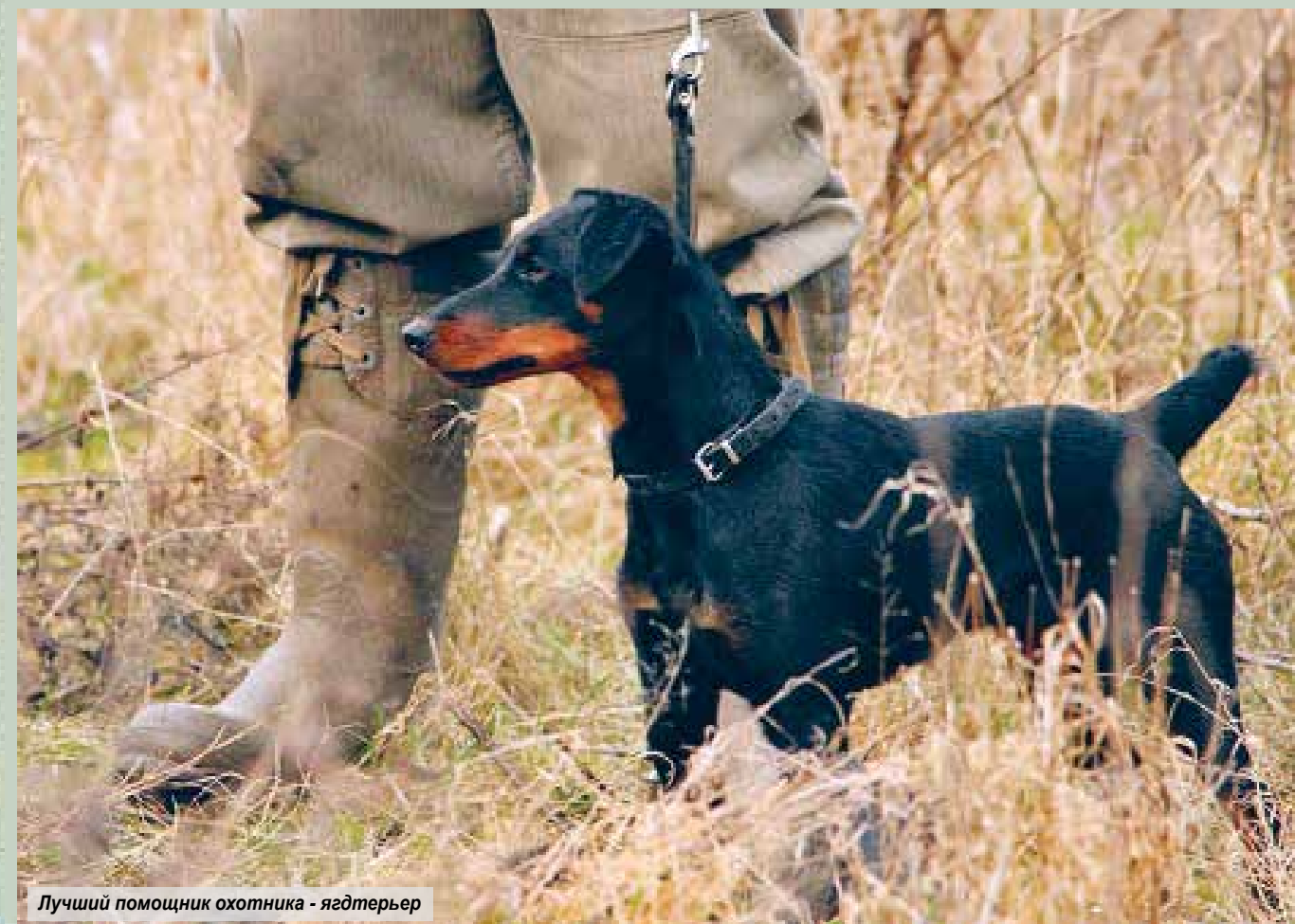
Лучший помощник охотника - ягдтерьер

По-разному ложится карта. Бывает, появится у молодого охотника такой бриллиант, и охотится малый, и цены-то ему не знает, и думает, что так и положено. Сравнить ему не с чем. Повезло человеку и, дай ему Бог ещё и детям показать охоту с этой собакой. Да, знаете, други мои, не часто так выходит. И кто терял, знает, как сиротеет охо-