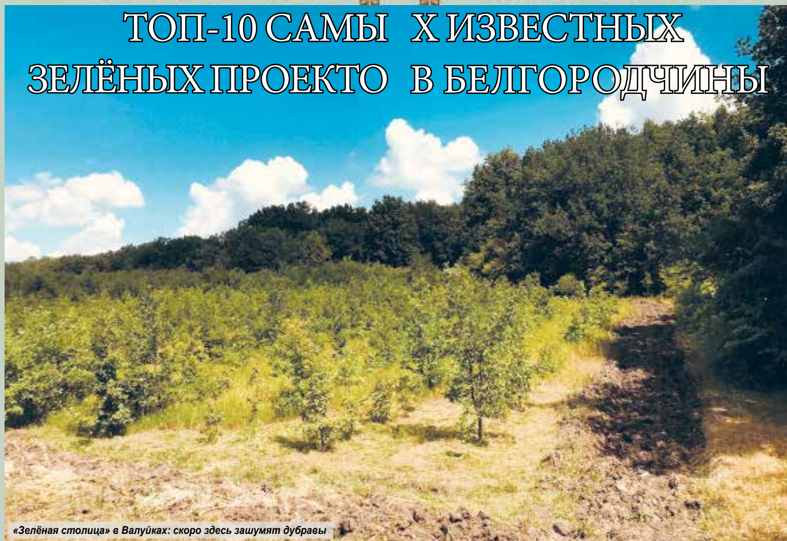
«Зелёная столица» в Валуйках: скоро здесь зашумят дубравы

ки разрабатывают интерактивную карту охотничьих угодий и особо охраняемых природных территорий регионального значения. Последних у нас свыше 300. Больше всего особо охраняемых природных территорий в Красногвардейском районе - 63.