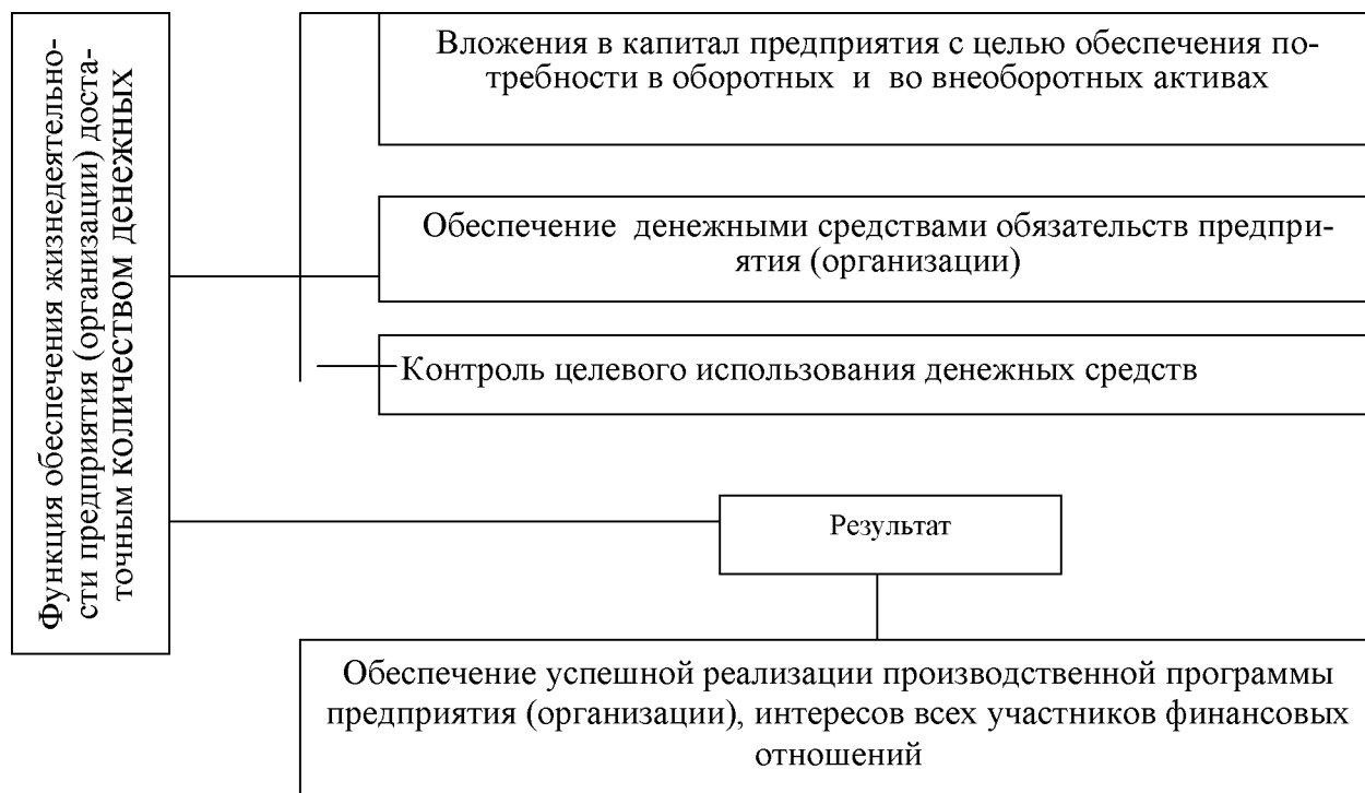
Рисунок 1. Функция обеспечения жизнедеятельности предприятия (организации) достаточным количеством денежных средств

Перечислите основные объективные и субъективные функции финансов. При характеристике функций используйте данные рисунка 1.