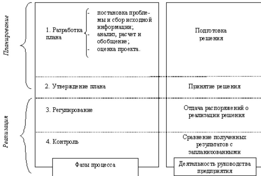
Рисунок 1. Технология разработки бюджета расходов на персонал

Разработка бюджета включает в себя четыре основных этапа. Дать характеристику каждому из них.