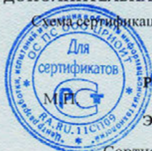
Схема сертификации – 3