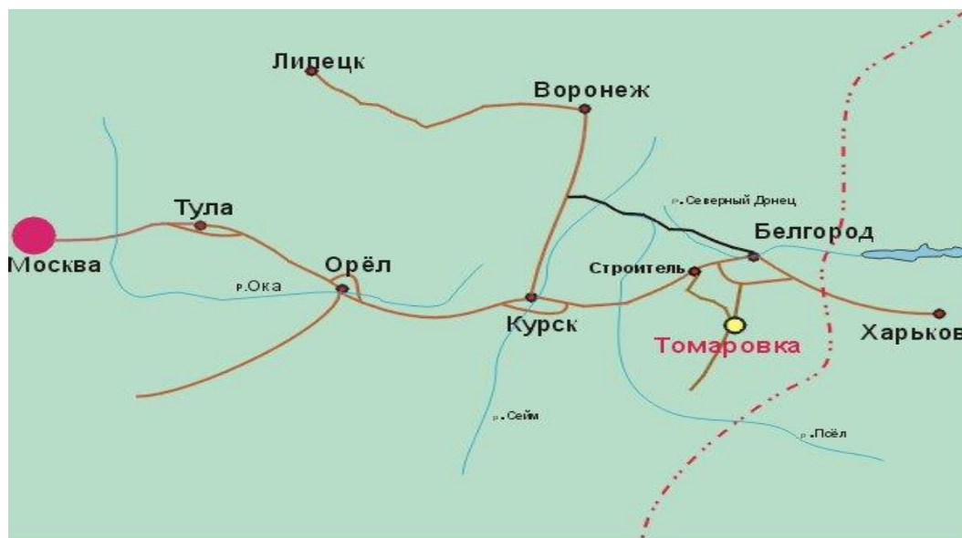
Рисунок 5. Расположение ЗАО «Томмолоко» Яковлевского района Белгородской области